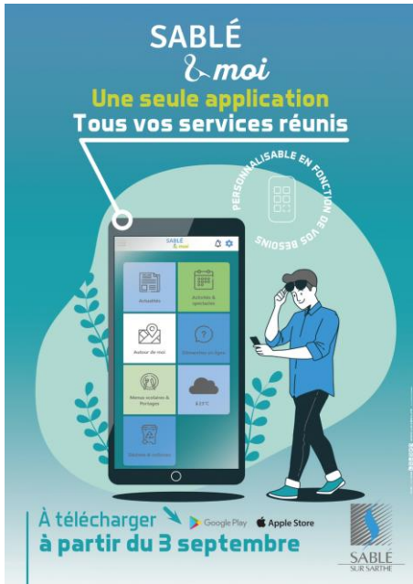
SABLÉ & moi